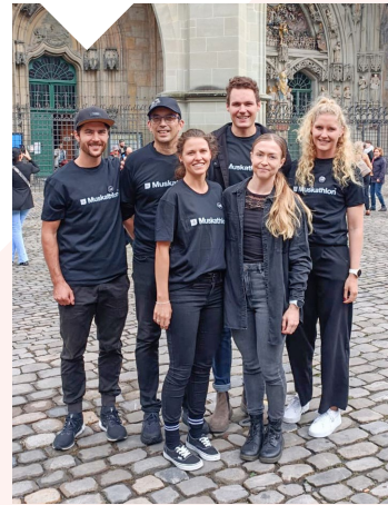
Muskathlon-Team am Walk for Freedom